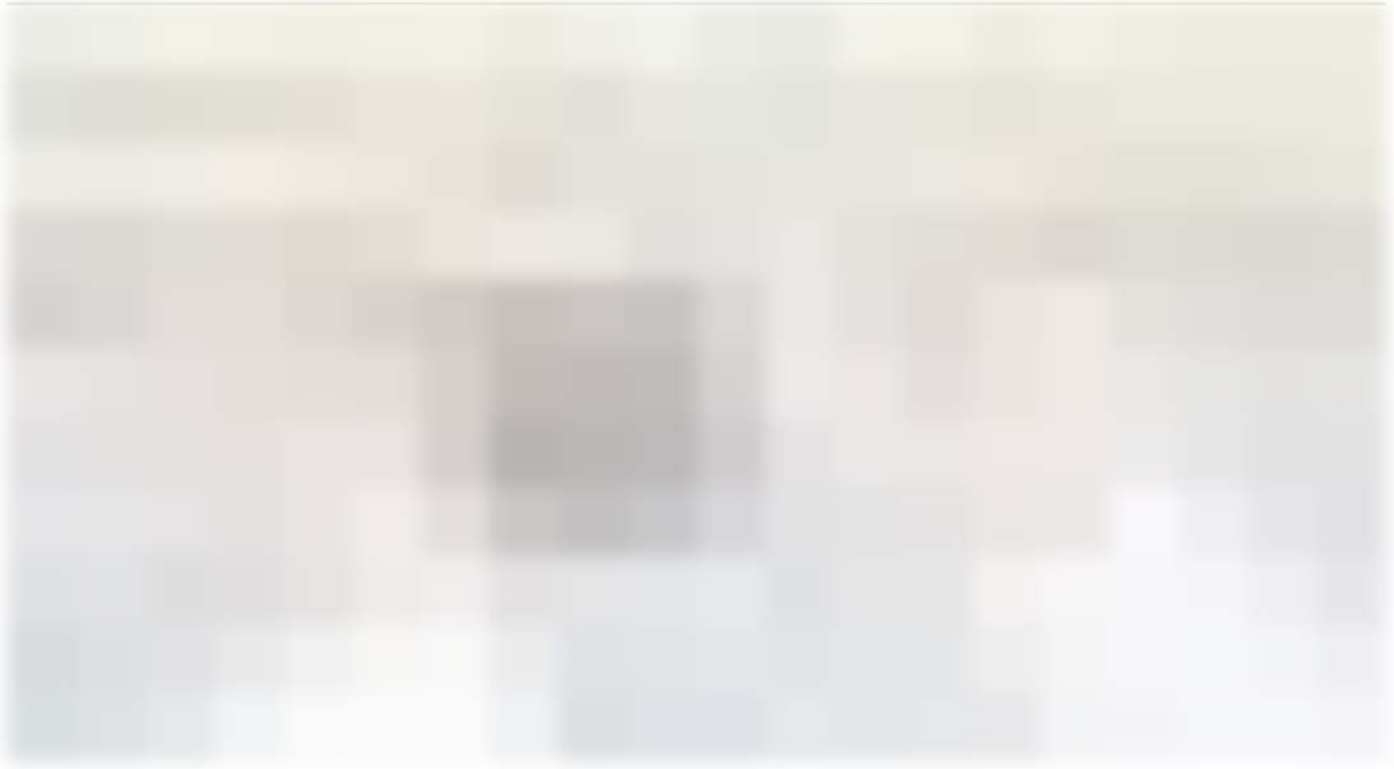
Kakbah di Makkah

Bagi orang desa, berdirinya “agen umrah” tentu membawa kabar gembira. Ketika Ongkos Naik Haji (ONH) belum dapat dikantongi, tersedianya jasa layanan keberangkatan ke tanah suci dengan harga miring menjawab sebagian permasalahan mereka. Dalam taraf tertentu, dilaksanakannya ibadah umrah mengandung ikhtiar “menghibur diri” saat rukun Islam yang kelima belum mampu ditunaikan.