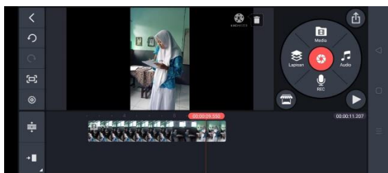
Gambar 1: Tampilan Aplikasi Kinemaster

Pada tahap desain, hal yang dilakukan awal adalah penyusunan naskah materi kemudian di mulailah rancangan metode pembelajaran dan kemudian dilanjutkan dengan penyusunan materi dengan menggunakan aplikasi Kinemaster yang nantinya hal tersebut dilakukan oleh peserta didik serta dilakukan presentasi oleh mereka. Pada tahap development adalah tahap merealisasikan produk pembelajaran berbasis android dengan menggunakan aplikasi Kinemaster , media pembelajaran ini dibuat dengan standar stand alone yakni dapat berjalan dengan tanpa terhubung dengan saluran internet ( offline ), berikut bentuk penggunaan Aplikasi Kinemaster