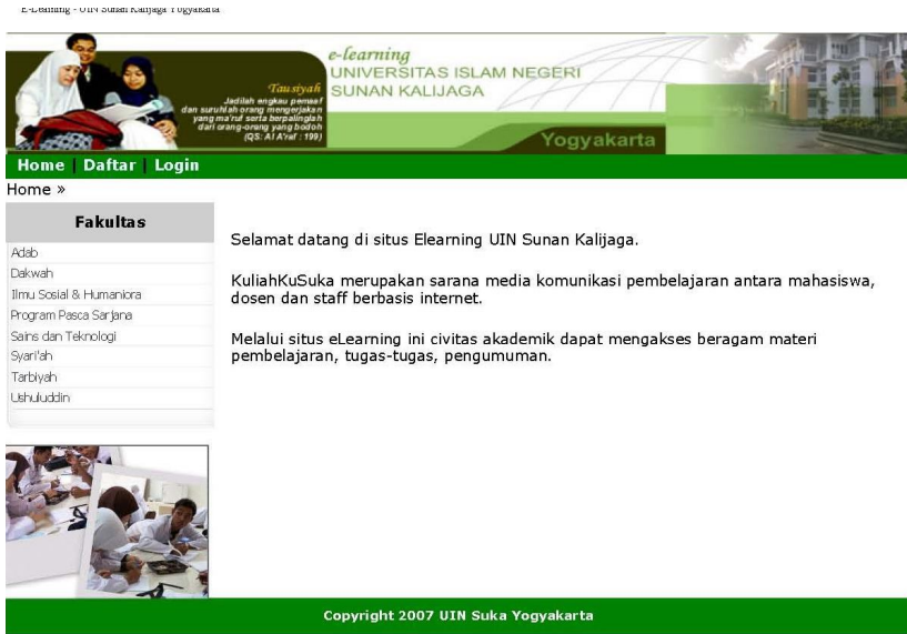
Gambar 5.10 E learning Universitas Islam Sunan Kalijaga Yogya