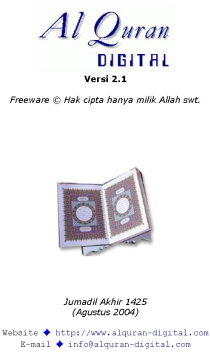
Gambar 5. 11 Al Quran Digital