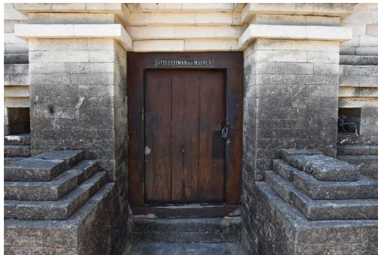
Gambar 5: Pintu Masuk Bangunan Cungkup Fatimah binti Maimun yang Berukuran Rendah 24

penghormatan bagi tokoh yang dimakamkan di dalamnya. Tidak hanya itu, pintu masuk ke dalam cungkup tersebut dibuat berukuran rendah. Sehingga peziarah yang akan masuk ke dalam bangunan cungkup tersebut harus menundukkan kepalanya agar bisa masuk. Hal tersebut bermakna, tokoh dalam makam tersebut merupakan tokoh yang dimuliakan dan luhur kedudukannya. Sehingga peziarah diminta memberikan penghormatan dengan cara menunduk sedari awal berada di tempat pintu masuk cungkup makam tersebut. Hal tersebut dapat dilihat pada gambar di bawah ini: