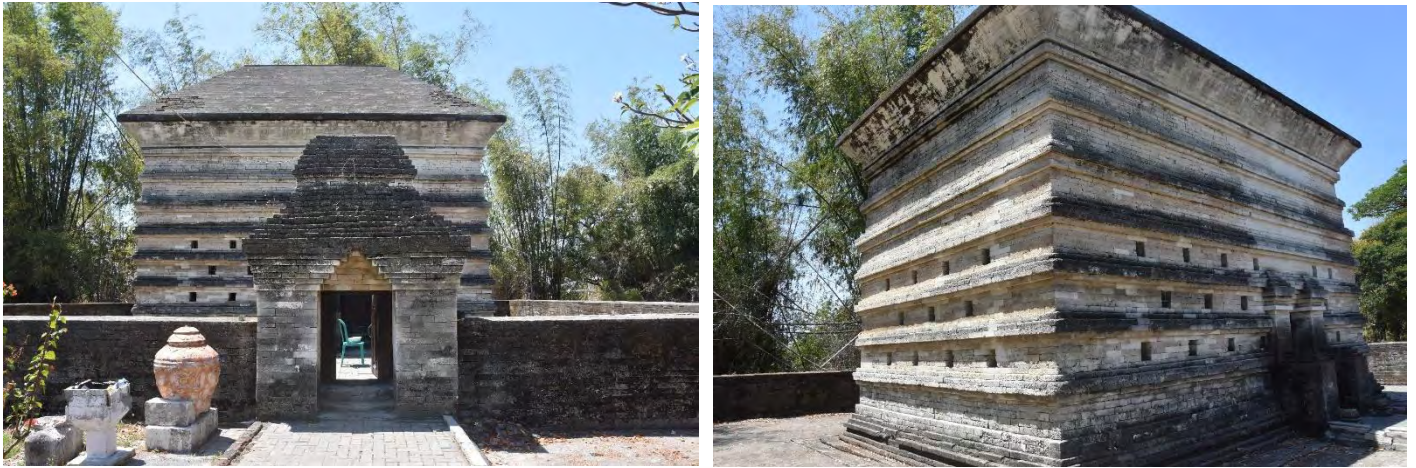
Gambar 3 dan 4: Sebelah Kiri merupakan Gambar Bangunan Cungkup Putih Makam Fatimah binti Maimun Tampak Depan. Sebelah Kanan merupakan Gambar Cungkup Putih Makam Fatimah binti Maimun Tampak Samping 22

Selanjutnya, legenda wafatnya Dewi Siti Suwari dan rombongan Kerajaan Gedah akibat terjangkit wabah penyakit mematikan tidak hanya berbenti pada cerita kembalinya rombongan keluarga Kerajaan Gedah dari Leran ke Negeri Gedah. Namun diceritakan pula ketika Prabu Brawijawa mendengar kabar bahwa Dewi Siti Suwari telah meninggal dunia di Leran dan setelah beliau mengetahui pemberian Buah Delima dari Raja Gedah berisi perhiasan emas serta batu permata, maka beliau menyesal telah menolak pinangan Raja Gedah kepada dirinya. Karena penyesalan tersebut, maka beliau datang ke Leran dan memerintahkan prajuritnya untuk membangun cungkup pada makam Dewi Siti Suwari. Hal tersebut dapat diketahui berdasarkan kutipan di bawah ini: