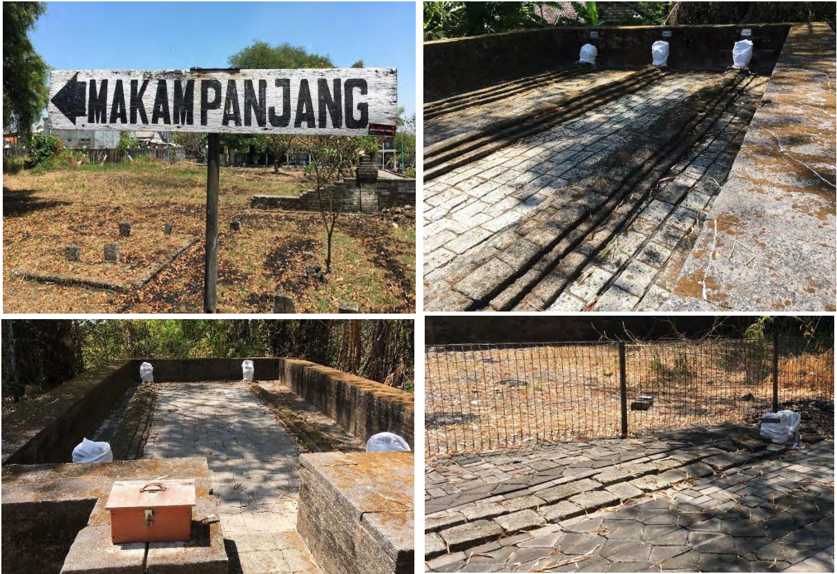
Gambar 6, 7, 8 dan 9: (6) Gambar Arah Panah menuju Makam Panjang, (7) Gambar Kompleks Jirat Makam Sayid Karim; Sayid Dja'far dan Sayid Syarif, (8) Gambar Kompleks Jirat Makam Sayid Djalal dan Sayid Djamal, serta (9) Gambar Kompleks Jirat Makam Sayid Djamaludin 34

pagar besi. Keterangannya merujuk pada jirat makam milik Sayid Djamaludin. Hal tersebut dapat dilihat pada gambar di bawah ini: