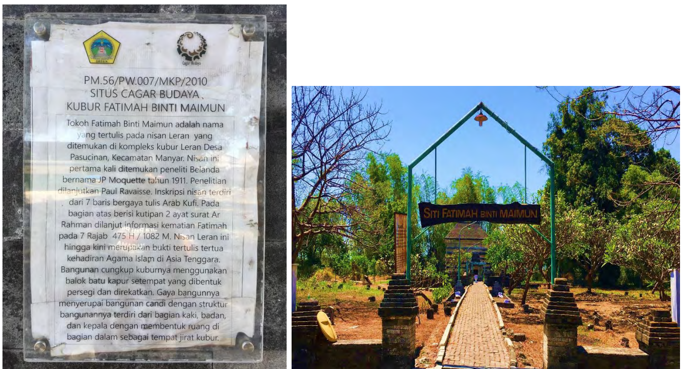
Gambar 1 dan 2: Sebelah Kiri Gambar Papan Informasi Tokoh dan Waktu Wafat Fatimah binti Maimun dan Sebelah Kanan merupakan Gambar Gapura Kompleks Makam Leran 17

Informasi terkait nama tokoh dan waktu wafat Fatimah binti maimun tersebut tercatat dalam batu nisan beliau 16 . Namun saat ini batu nisan tersebut tidak disimpan dalam kompleks makam Leran, melainkan tersimpan di Museum Trowulan, Mojokerto, Jawa Timur. Adapun informasi terkait tokoh Fatimah binti Maimun tersebut dapat dijumpai para pengunjung pada papan tulisan dinding kompleks makam tersebut. Hal itu dapat dilihat pada gambar di bawah ini: